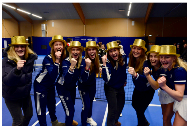
Guldhattarna på när damlaget firar sitt SM-guld.