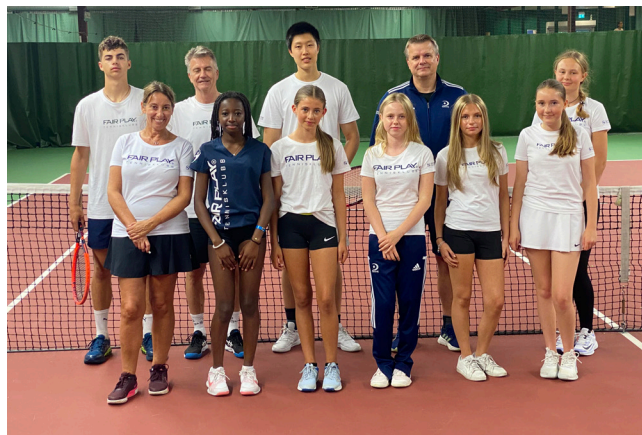
Några av tränarna på vår årliga tränarutbildning.

I början på det nya verksamhetsåret får bland annat våra tränare genomgå en utbildning i form av ett tränarkörkort. Detta kommer användas i flera delar av verksamheten, och är en utbildningsform som man kan göra via mobilen och på sin "egen tid". Det är en stor fördel i en organisation som vår, där det är svårt att synka tider för alla att komma loss samtidigt.