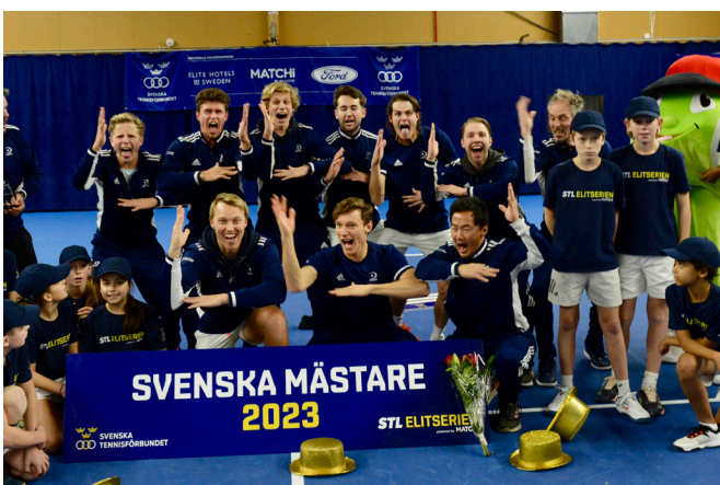
Fair Plays herrlag tog SM-guld på Lidingö.

Flera av våra spelare har också lyckats bra internationellt, och under året har vi haft flera spelare som blivit uttagna till landslaget eller landslagsläger. Rankinglistorna på WTA och