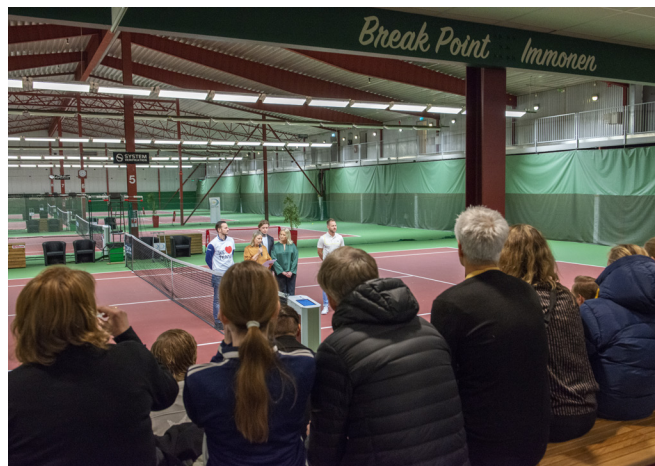
Den nybyggda läktaren Break Point Immonen invigdes lördagen den 2 mars.

Samtidigt beslutade vi oss för att vi måste försöka fortsätta vår utveckling av såväl verksamhet som anläggning. Det är viktigt att